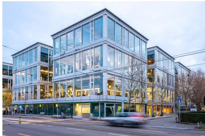
Yond Aussenansicht

Das Gebäude wurde im Lean-Construction-Prozess geplant. So wurden beispielsweise die Haustechnik-Unternehmer in einem Werkgruppenprozess ausgewählt. Der Grundausbau des Gebäudes ist im 1.-3. OG doppelgeschossig, die Mieter bestimmen nach eigenen Wünschen die Bereiche mit ausgebautem Zwischenboden.