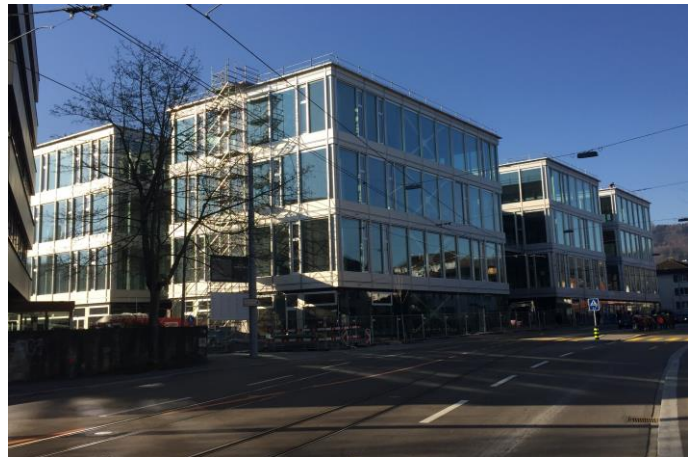
Yond Aussenansicht Gebäude

Der Mieter wurde einerseits an die Lüftungs- und Kälteproduktion aus dem Grundausbau angeschlossen, für die Konferenzzone musste zusätzlich ein eigener Monobloc auf die Mietfläche gestellt werden. Sowohl die Grossraumfläche als auch die einzelnen Sitzungszimmer wurden mit Kühldecken ausgerüstet. Ein Teil der Sitzungszimmer hält erhöhte Schallschutzanforderungen ein, mit entsprechenden Massnahmen bei den technischen Installationen. Das gesamte Projekt wurde in 3D geplant.