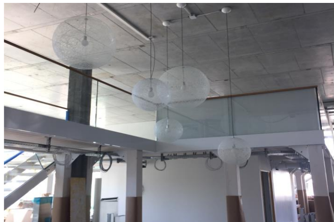
Innenausbau während der Bauphase